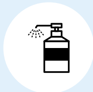
除菌スプレー設置